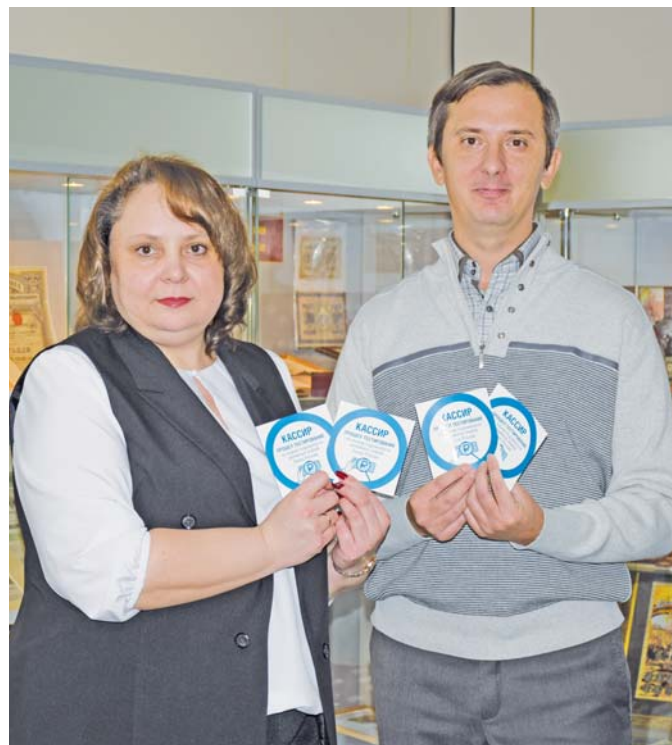
На фото: Всем кассирам, успешно «сдавшим экзамены», вручили сертификаты и наклейки для рабочих мест.

Учебный курс, а также порядок участия в Программе, включая технические требования к персональному компьютеру участников, доступны на сайте Университета Банка России university.cbr.ru . Регистрация на учебный курс осуществляется через представителей розничных сетей (ответственных координаторов).