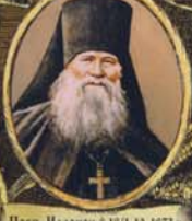
Преп. Наарон † 18/1.10.1873г.