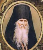
Преп. Амвросий † 10/23.10.1091г.