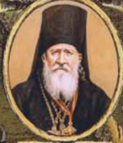
Преп. Мenseй † 16/29.6.1862г.