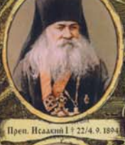
Преп. Исакий I † 22/4.9.1894г.