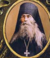
Преп. Варсонофий † 1/14.4.1911г.