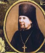
Преп. Нестор † 29/12.5.1928г.