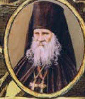
Преп. Макарий † 7/20.9.1860г.