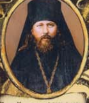
Преп. Никон исп. † 25/8.7.1931г.