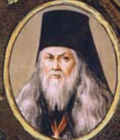
Преп. Леон † 11/24.10.1841г.