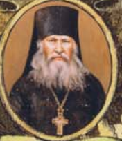
Преп. Исакий II † 26/8.1.1930г.