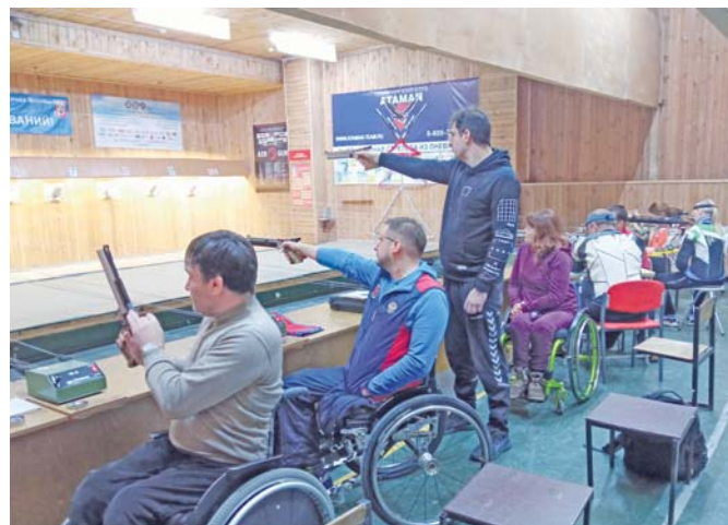
На снимке: на огневом рубеже.